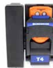
Voertuigoplader Handig opladen en opbergen terwijl u onderweg bent