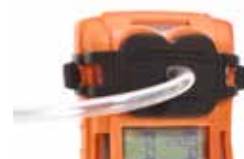
Bump-/kalibratieplaat Voor het toepassen van testgas op T4