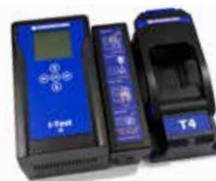
I-Test Eenvoudige geautomatiseerde oplossing voor bump-testen en kalibreren