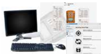
NIEUW Portables Pro 2.0 Software Voor gemakkelijke configuratie en onderhoud