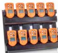
10 weg-oplader Voor het opladen en opbergen van uw T4-arsenaal