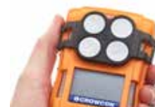
Externe filterplaat Opklembaar filter voor stoffige omgevingen