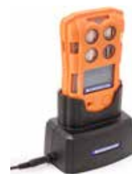
Opladhouder Dockingstation voor eenvoudig opladen