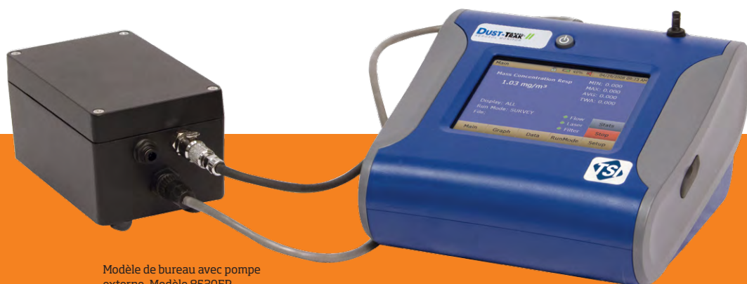
Modèle de bureau avec pompe externe, Modèle 8530EP