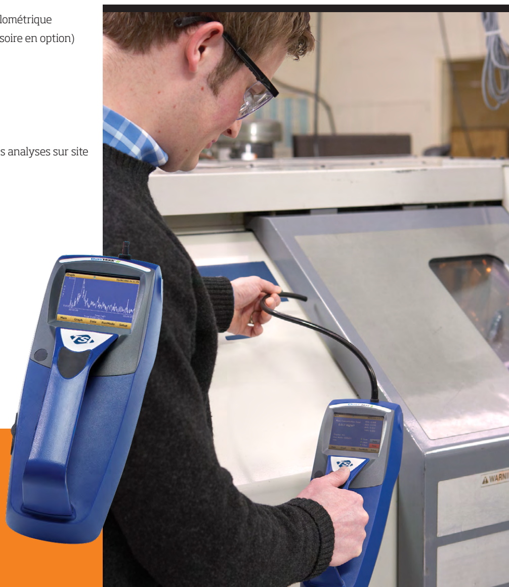
Modèle portable Modèle 8532

Le logiciel d'analyse des données TrakPro™ vous permet d'effectuer la configuration et la programmation directement à partir d'un ordinateur. Il est doté d'une nouvelle fonctionnalité de programmation et d'acquisition des données à distance à partir de votre PC par des communications sans fil (922 MHz ou 2,4 GHz) ou sur un réseau Ethernet. Comme auparavant, vous pouvez imprimer des graphes, des tableaux de données brutes et des rapports détaillés pour vos dossiers.